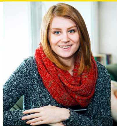
Слово руководителя рейса «Безопасное колесо»

Команда-победитель краевого этапа представит регион на Всероссийском конкурсе юных инспекторов движения «Безопасное колесо – 2016», который пройдет с 1 по 8 июня на базе всероссийского центра «Океан» во Владивостоке.