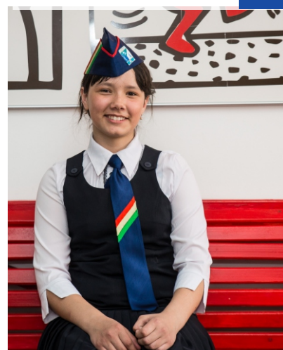
Мой «Звездный друг»