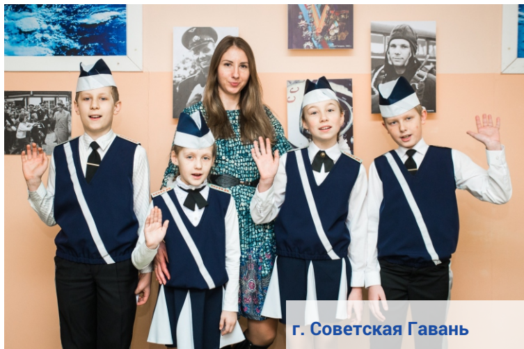
г. Советская Гавань