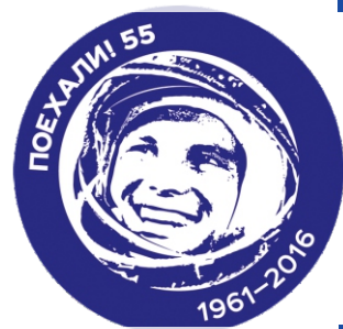
Конкурс «Подними голову»