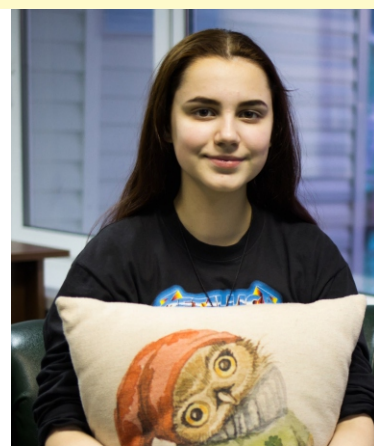
«ШЮЖ» VS «ВІТ»

Теперь, когда участники отобраны, остается пожелать всем удачи и победы в фестивале детских и юношеских СМИ «МКС. Медиа. Команда. Содружество».