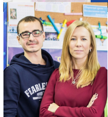
Шоу ведут профессионалы