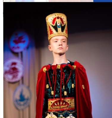
Правитель XIV эпохи