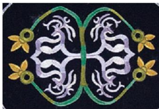
2. Гладевый шов