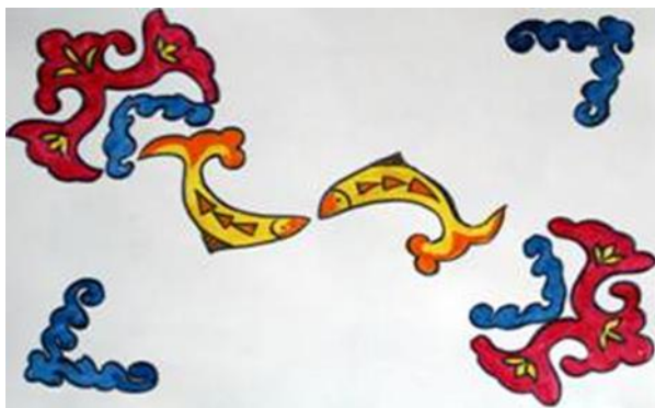
1. Поцелуй рыбок – это оберег материнства

Орнамент отражал окружающую действительность из растений, цветов, насекомых, рыб, добрых зверей и птиц. Он выделялся своеобразной формой и имел своё назначение.