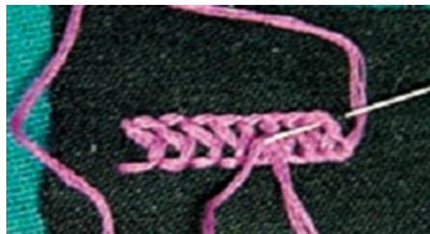
Вариант двутамбурного шва