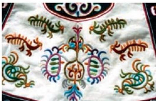
1. Обычный плотный гладевый шов без настила

Не менее красив и потому, часто используется гладевый шов. Он имеет несколько вариантов: гладевый обычный плотный без настила, гладевый по настилу, и тот, и другой в два и несколько рядов, гладевый отделочный, гладевый обмёточный или кромочный, гладевый с прикрепом в один и несколько рядов, гладево-петельный и другие. Гладевый обычный плотный без настила выполняется по самой простой технологии: нитка обматывает намеченную полоску ткани. Главное при этом – соблюдать абсолютно ровные края гладевой ленты, ни одна нитка ни по верху, ни по низу ленты не должна выбиваться из ряда, образуя «зубчики».