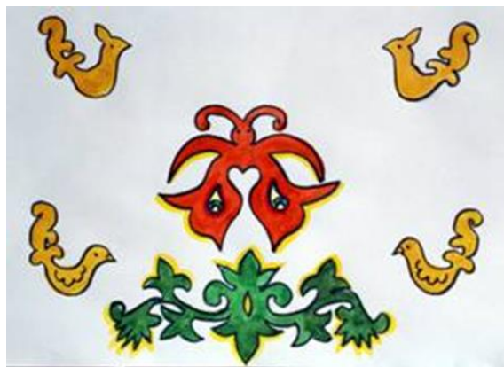
2. Птицы и звери, насекомые и змеи, бабочки – символ семейного счастья.

3. Халат, на котором изображено древо жизни с птицами и зверями – говорит о богатстве и достоинстве молодых. А птички – это души не родившихся детей.